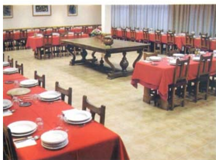
Comedores: Abantos: (100 personas). San Lorenzo: (200 personas). Escorial: (250 personas).